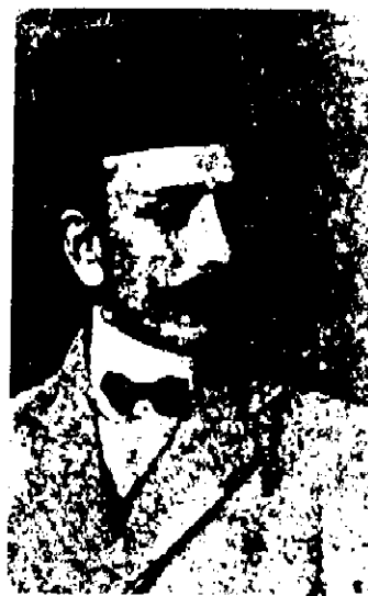
مرحوم علی اکبر دهخدا

ازای امتیازاتی که گرفته بودند، حمایت می کردند غارت شد. در کودتای ۲۸ مرداد ۱۳۳۲ و جریانات مقدماتی قبل از آن، که از چند سال قبل از آن توسط خائنان و نوکران بیگانگان شروع شده بود، نیز مساند کودتای ضد مشروطیت محمدعلی شاه، روزنامه نگاران قربانیانی دادند که محمد مصدق مدیر روزنامه مرد امروز (مقتول به سال ۱۳۲۶) و کریم پور شیرازی مدیر روزنامه شورش و مرتضی کیوان (شاعر و نویسنده) سرشناس ترین آنها بودند. محمد مصدق قبل از کودتا کشته شد و کریم پور شیرازی را بعد از کودتا زنده زنده سوزاندند. مرتضی کیوان نیز تیرباران شد جز این عدلهایی از روزنامه نگاران به زندان افتادند، تبعید شدند و یا مورد انواع آزارها و تخفیف ها قرار گرفتند.