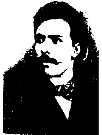
میرزا جهانگیرخان (صوراسرافیل)

و راست و میانه‌رو قرار داشتند و بعضاً مستقیماً در خدمت سیاست بیگانگان بودند.